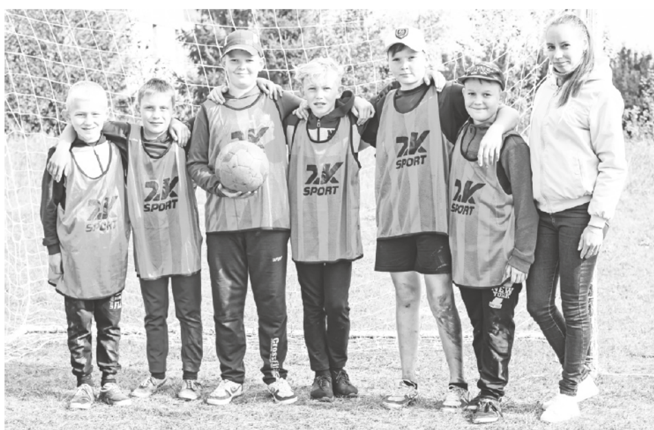
Шадринцы — победители группы 2007-2008 годов рождения.

Тем временем в категории 2007-2008 годов рождения кипела страсть. В первой игре встречались шадринский «Кристалл» и «Спутник» (Байкалово). Первый тайм прошёл под диктовку хозяев поля. На перерыв они ушли, ведя в счёте, реализовав пенальти. Во втором тайме «Кристалл» бросился отыгрываться, байкаловцы, напротив, испугавшись своей прыти, прижались к воротам. За несколько минут до финального свистка шадринцы нашли брешь в обороне «Спутника» и сравняли счёт, 1:1. Кульминация наступила