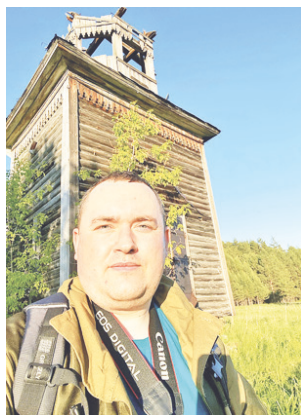
На фоне занинской церкви.