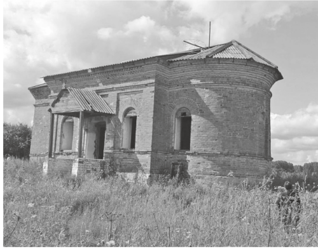
Часовня в Воинковой.

Согласно исторической справке Байкаловского краеведческого музея, Воинкова основана в 1680 году. О появлении названия существует две основные легенды. Первая гласит: по указу Петра Первого на Урал были сосланы прощтрафившиеся воины, стрельцы. Они-то и основали деревню и нарекли её Воинкова. Согласно второй – основателями были бежавшие крепост-