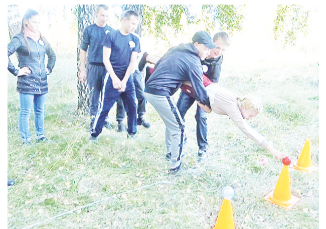
Финальный квест.