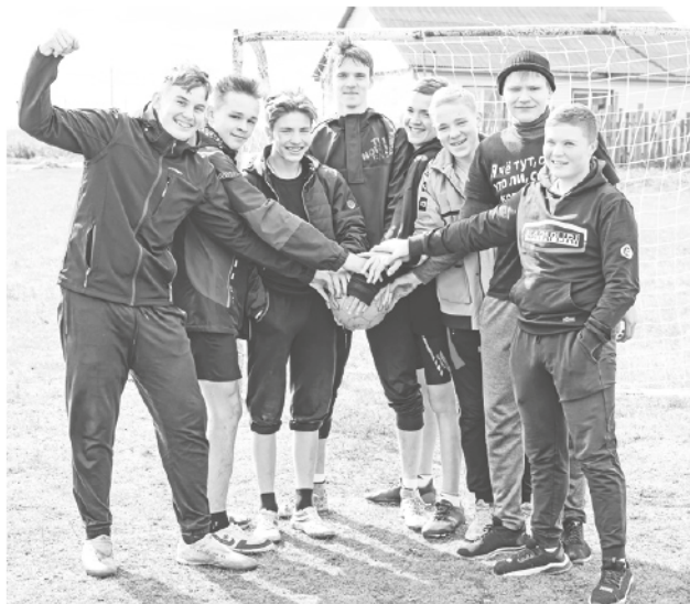
«Сахалинец» — чемпион.