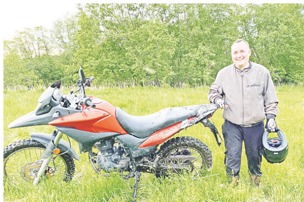
«С детства люблю мотоциклы».